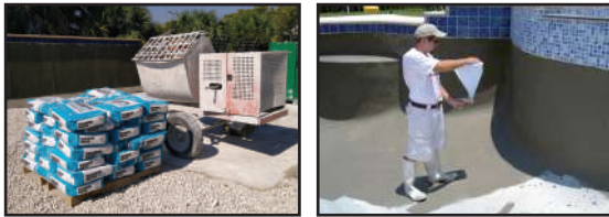
Dimensionamiento y Preparación