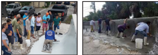
Técnicas de Aplicación